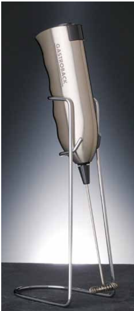
Art.-No. 42219 Latte Max milk frother

Read all provided instructions before first usage! Model and attachments are subject to change! For domestic use only!